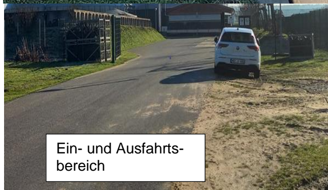
Ein- und Ausfahrtsbereich