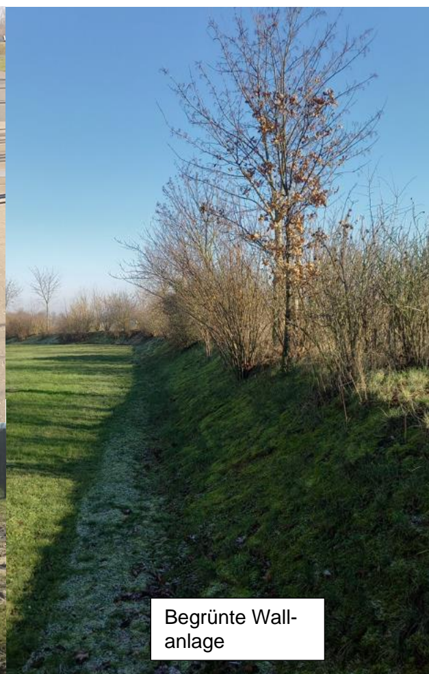
Begrünte Wall- anlage