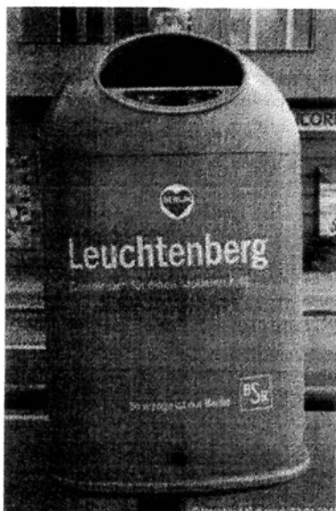
Dieser Aschenbecher aus Berlin zeigt beispielhaft wie so ein Abfallbehälter aussehen könnte

Dabei haben sich Abfallbehälter mit integrierten Aschenbechern in anderen Städten bewährt. Wir beantragen daher, vorgenannte Abfallbehälter aufzustellen.